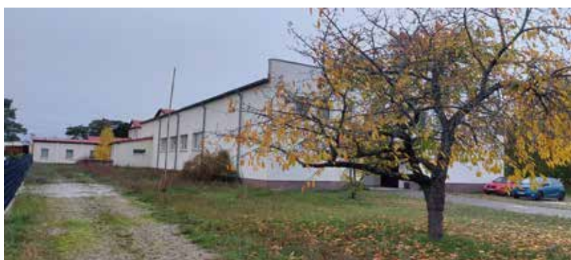
Südansicht – Bereich Saal