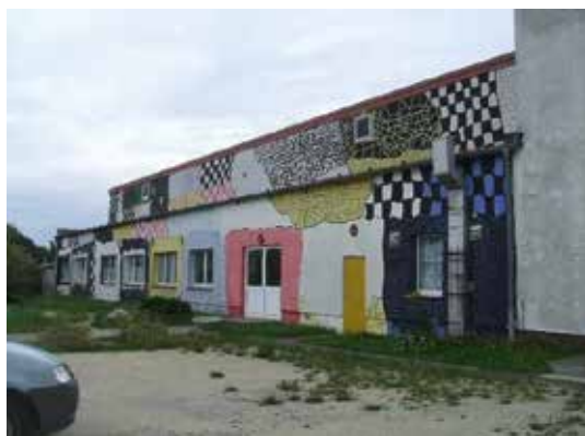
Nordansicht – Bereich Saal