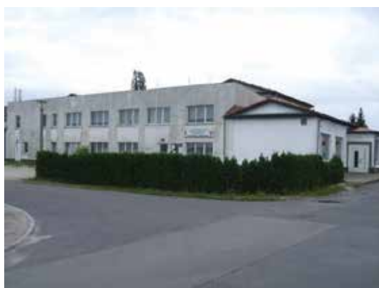
Nordansicht – Bereich Kegler