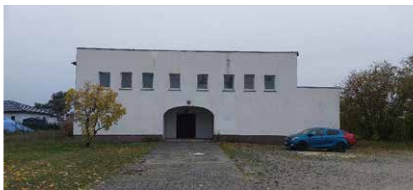
Ostansicht – Saal –